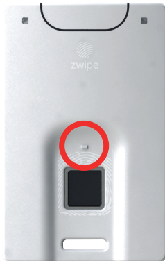
Нажмите кнопку питания