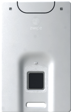
Карта Zwipe Access