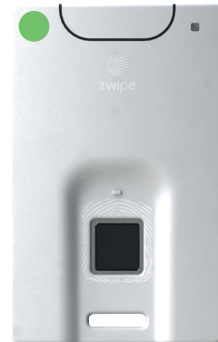
Зеленый СИД начнет мигать